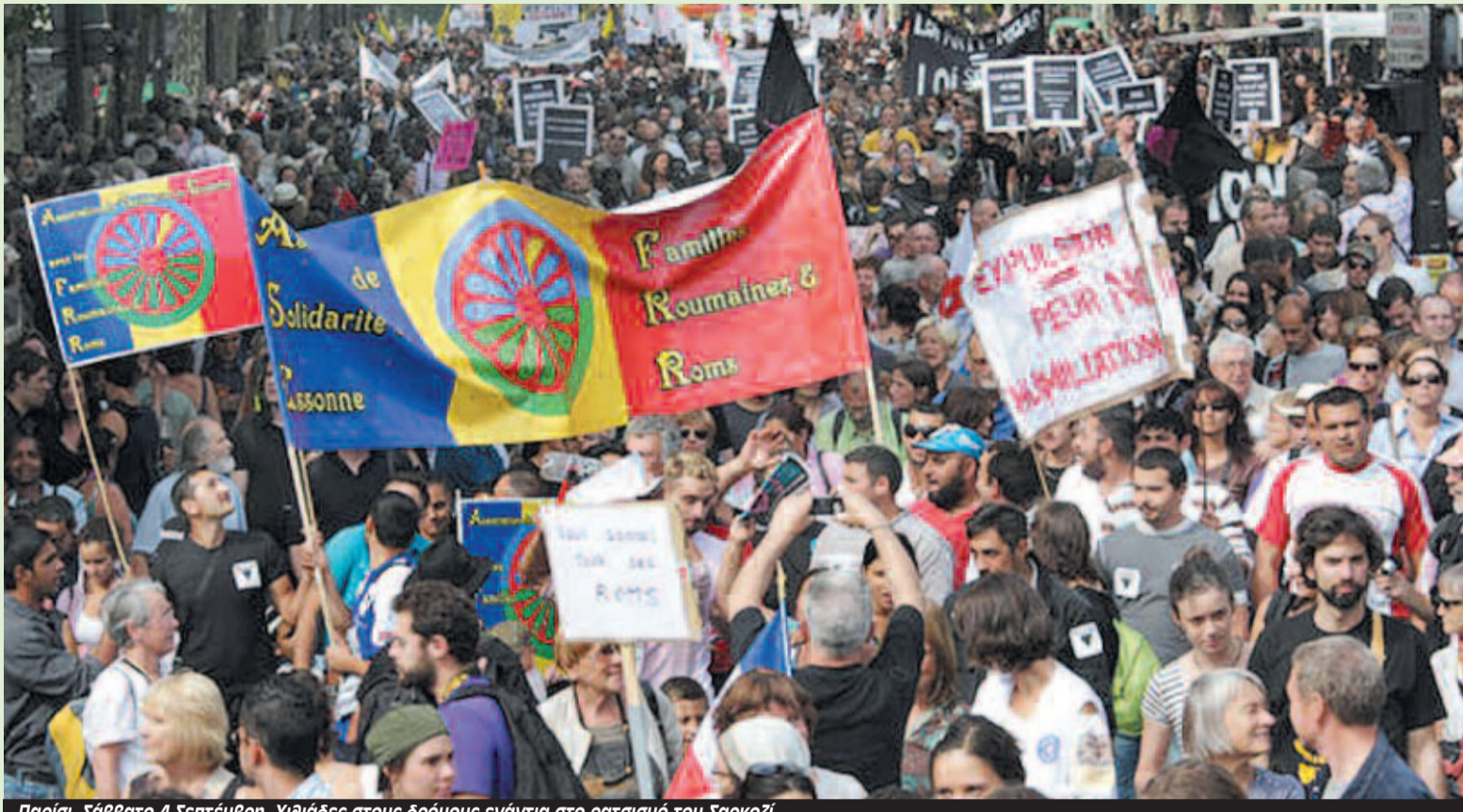
Παρίσι, Σάββατο 4 Σεπτεμβρίου. Χιλιάδες στους δρόμους ενάντια στο ρατσισμό του Σαρκοζί

Δύο ημέρες πριν την Γενική Απεργία το Σάββατο 4 Σεπτεμβρίου χιλιάδες διαδήλωσαν κατά της ρατσιστικής πολιτικής του Σαρκοζί στο Παρίσι και σε 94 ακόμα πόλεις. Το κάλεσμα των αντιρατσιστικών διαδηλώσεων συνυπέγραψαν 30 αντιρατσιστικές και αριστερές οργανώσεις. Εκπρόσωπος της οργάνωσης "La Voix des Roms" δήλωσε στην εφημερίδα Socialist Worker: "Εκτός από τις απελάσεις των Ρομά ο Σαρκοζί σχεδιάζει να τους βάλει σε περιφραγμένα ειδικά στρατόπεδα απομονωμένα από την κοινωνία, με την φύλαξη της αστυνομίας και άλλων δυνάμεων. Ακόμα και οι επισκέπτες θα ελέγχονται από τους φρουρούς. Αυτή είναι άλλη μία μορφή καταπίεσης μία προσπάθεια να μας αποκόψει από τη ζωή".