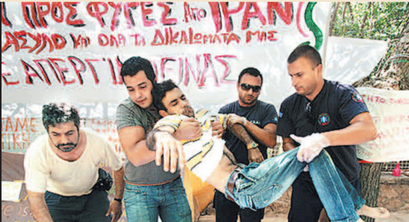
Οι πρόσφυγες από το Ιράν πέτυχαν μια νίκη χάρη στην αποφασιστικότητα του αγώνα τους και τη βοήθεια των συμπαραστών τους