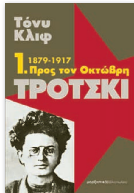
Ετοιμάζεται και θα κυκλοφορήσει τον Οκτώβρη και ο τέταρτος και τελευταίος τόμος.

Ο διεθνισμός ήταν στην καρδιά της πολιτικής των μπολσεβίκων. Τόσο ο Λένιν όσο κι ο Τρό-